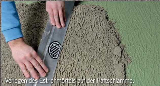
Verlegen des Estrichmörtels auf der Haftschlämme.

Erleben Sie die digitale Welt von ARDEX.